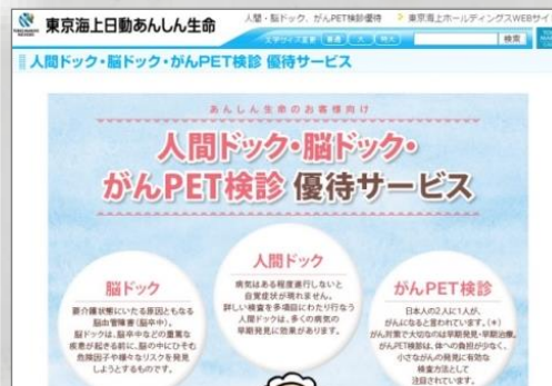
東京海上日動あんしん生命保険株式会社様 人間ドック・脳ドック・がんPET検診 優待サービス