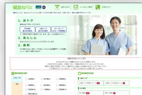
株式会社クレディセゾン様 健診予約サイト